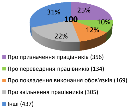
Накази по особовому складу апарату ДПС, %

Станом на 31.10.2023 штатна чисельність апарату ДПС становить 1629 одиниць; штатний розпис укомплектований на 90,7% (1478 посад), вакансій – 9,3 % (151 посада).